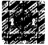
Zoraida Avalos Rivera Fiscal de la Nación

A handwritten signature in black ink, appearing to read "Zoraida Avalos Rivera".